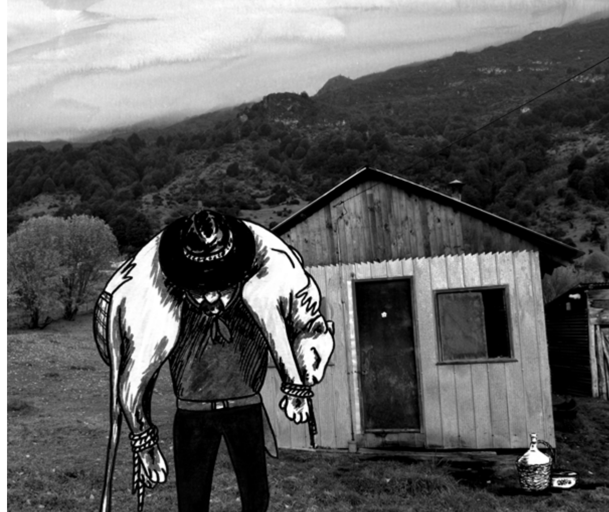
Y QUÉ, SI NO LO HABÍA MATADO. ESTABA BORRACHO NOMÁS